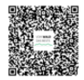
QR-Code für die online Buchung

Eine Anmeldung von Gästen aus Orten ohne Verkaufsstelle erfolgt online oder telefonisch über die Tourist-Info Bayerisch Eisenstein, Tel.: 09925 9019-001, bayerisch-eisenstein@ferienregion-nationalpark.de. Online Buchung: www.boehmerwaldcourier.eu Die Anmeldung ist bis zum Vortag 15 Uhr möglich.